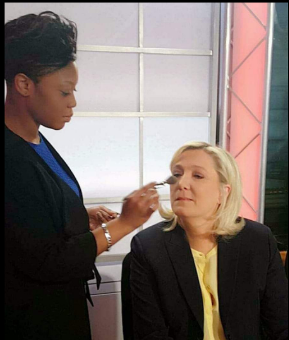
Députée Marine Le Pen