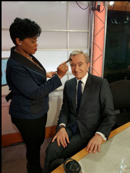
Mr Bernard Arnault LVMH