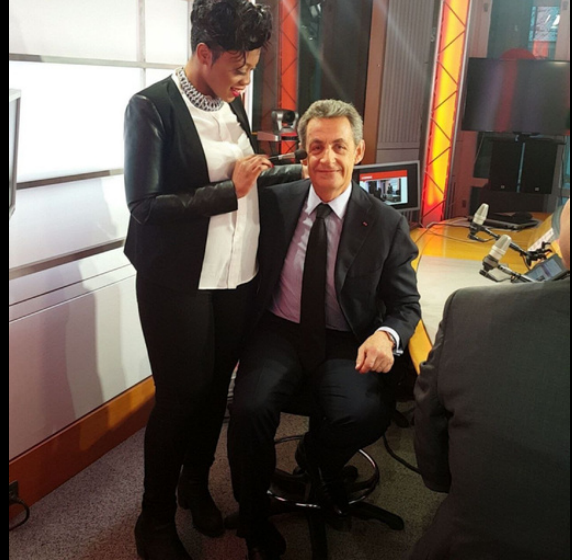
PR Nicolas Sarkozy