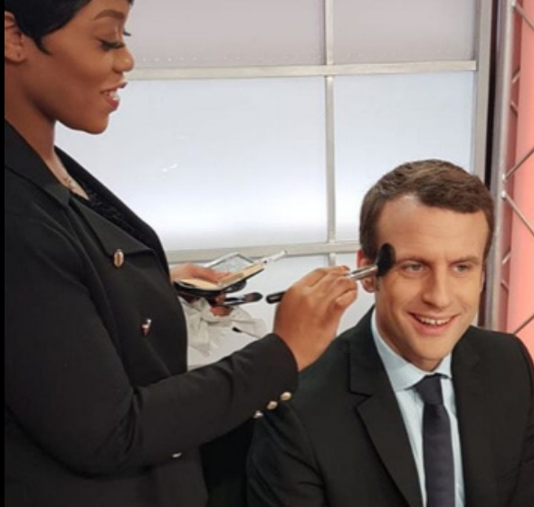
PR Emmanuel Macron